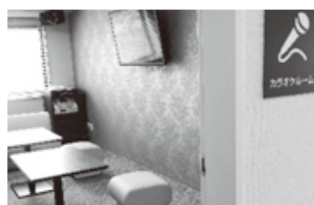
(写真B) カラオケルーム