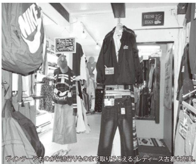
ヴィンテージものから流行りものまで取りそろえる。レディース古着も充実。