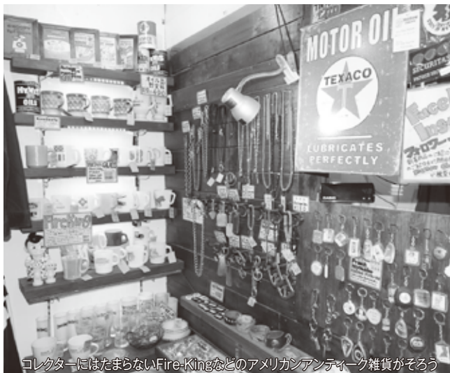
コレクターにはたまらないFire-Kingなどのアメリカンアンティーク雑貨がそろう