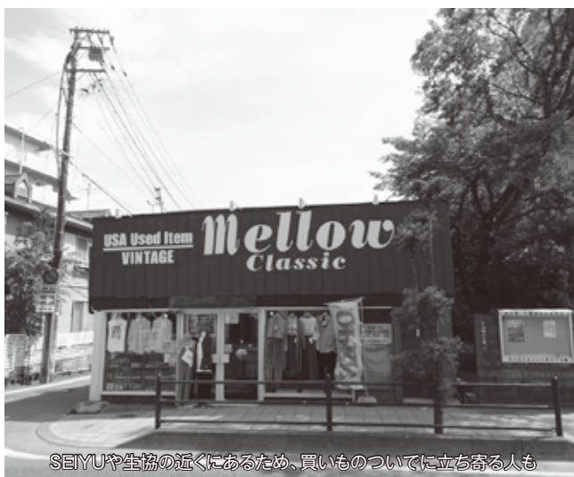
SEIYUや生協の近くにあるため、買いものついでに立ち寄る人も