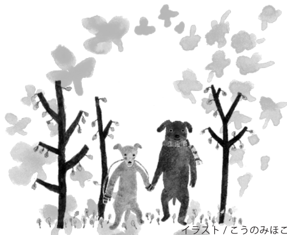
イラスト/こうのみほ