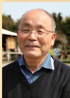
鹿児島県鹿屋市(旧申良町)／柳谷自治公民館館長、やねだん(柳谷町内会)会長