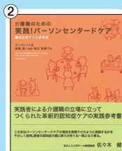
介護職のための実践! パーソンセンタードケア ～認知症ケアの参考書～ 価格：2,625 円(税込)