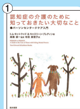
認知症の介護のために知 っておきたい大切なこと～ パーソンセンタードケア 入門 価格：1,575 円(税込)

はい、あります。入門書としては 『認知症の介護のために 知っておきたい大切なこと～ パーソンセンタードケア 入門』がわかり やすいでしょう。