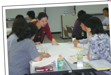
♪グループごとのワークは和やかな雰囲気♪