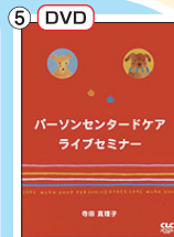
[DVD] パーソンセンタードケア ライブセミナー 価格：3,150 円(税込)

※本のご購入だけでも下記の申込用紙からできます。5,000 円以上で送料無料。 ※該当 No. の欄に冊数をご記入の上、お申し込みください。