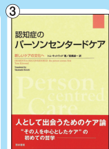
認知症の パーソンセンタードケア 価格：2,625 円(税込)