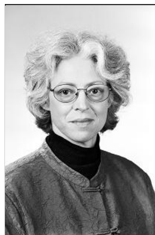
ビッキー・クラーク・ラビン

今回は、その研修で講師を務めている、バリデーショ ントレーニング協会ヨーロッパ支部代表のビッキー・クラーク・ラビン氏をお招きして、画期的な認知症ケアとして世界中で実績をあげているバリデーショ ンの導入編にあたるセミナーを開催します。