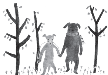
イラスト こうのみほこ

♪グループごとのワークは 和やかな雰囲気です♪ わからないときも講師が しっかりフォローするので安心！