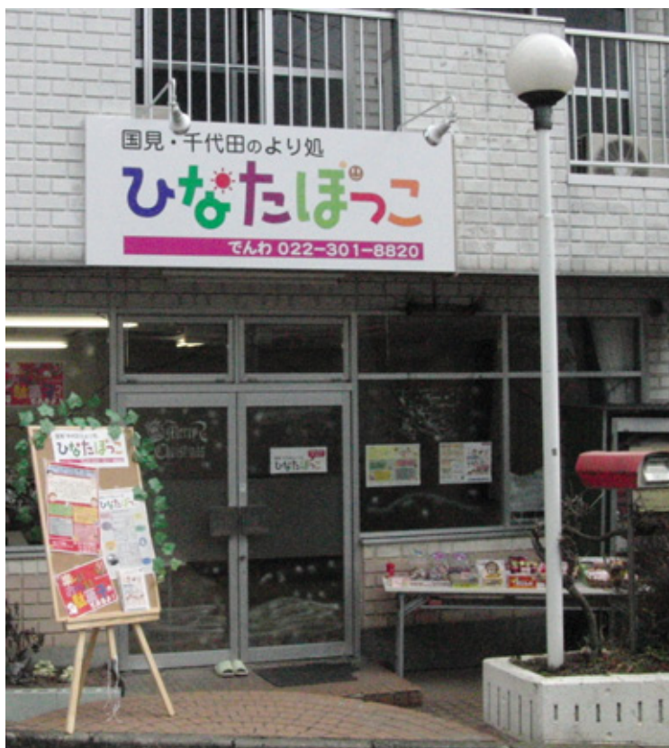
国見・千代田のより処「ひなたぼっこ」