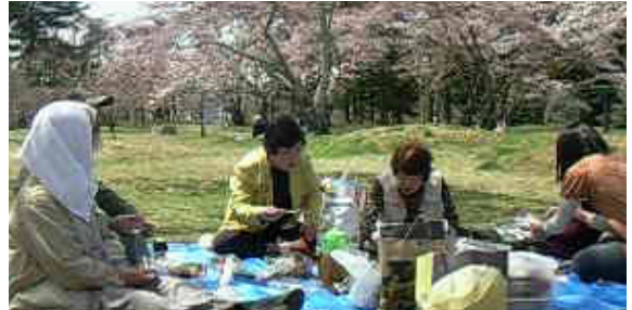
▲みんなで持ち寄ったお弁当で和気あいあいと・・・

TEL 022-738-8773 http://clc-japan.com/minnanoi/