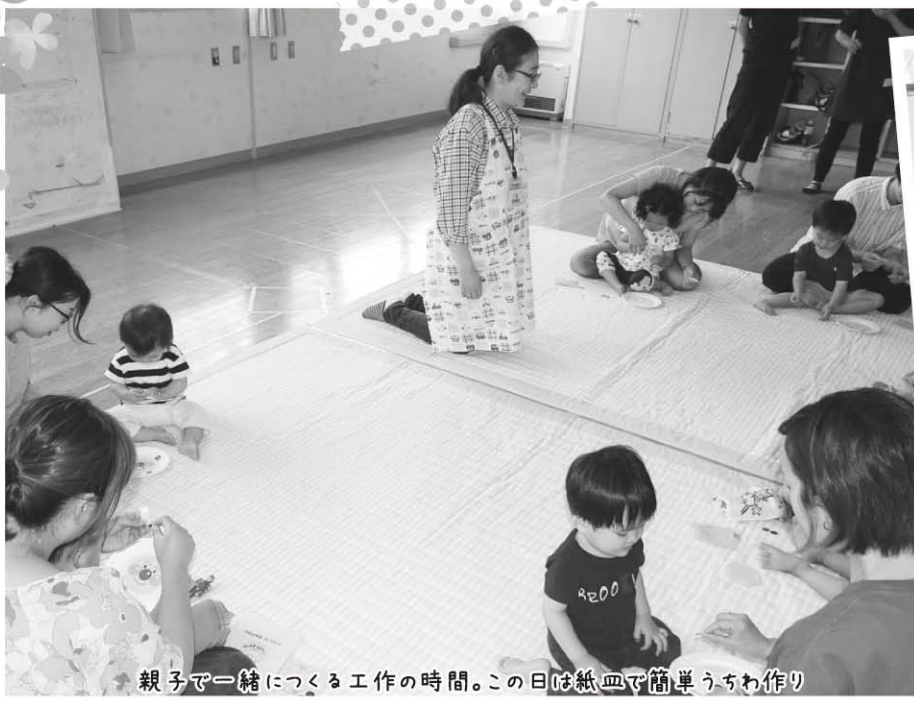
親子で一緒に作る工作の時間。この日は紙皿で簡単うちわ作り