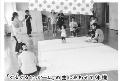
「ぐるぐるどっかーん」の曲にあわせて体操