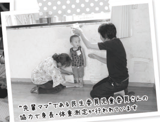
“先輩ママ”である民生委員児童委員さんの協力で身長・体重測定が行われています