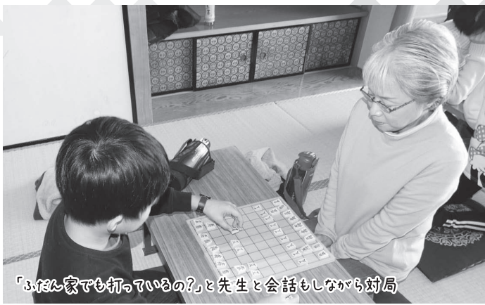
「3人家で打っているの?」と先生と会話しながら対局