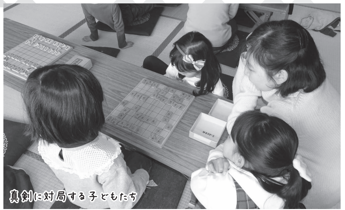
真剣に対局する子どもたち