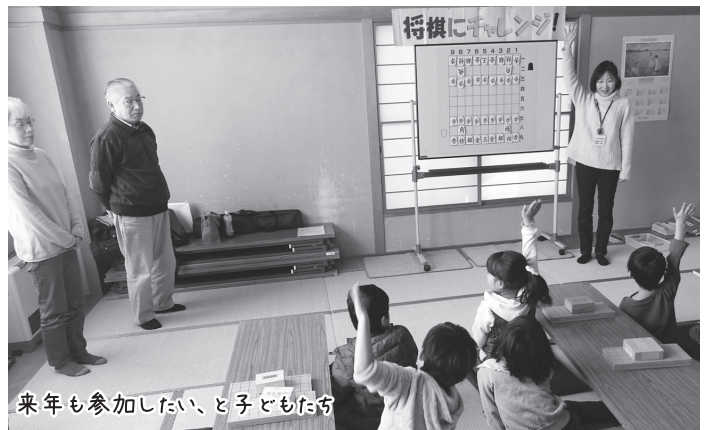
来年も参加したい、と子どもたち