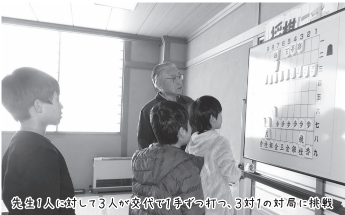
先生1人に対して3人が交代で1手ずつ打つ、3対1の対局に挑戦