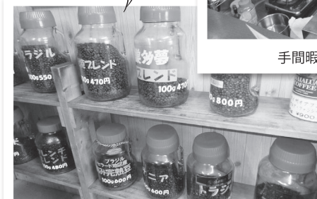
生産農園や品種、地域がわかるコーヒー豆にこだわる