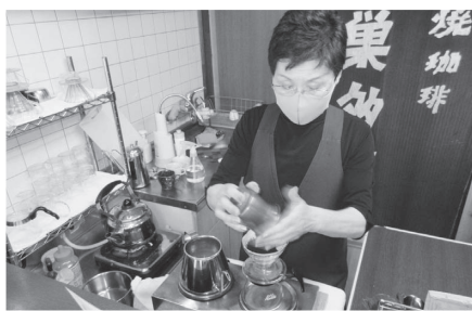
手間暇かけた焙煎コーヒー