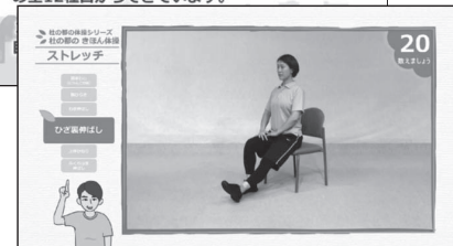
杜の都の体操シリーズ「杜の都のきほん体操」

杜の都のきほん体操は、 【ストレッチ】【筋力トレーニング】【全身運動】 の全12種目からできています。