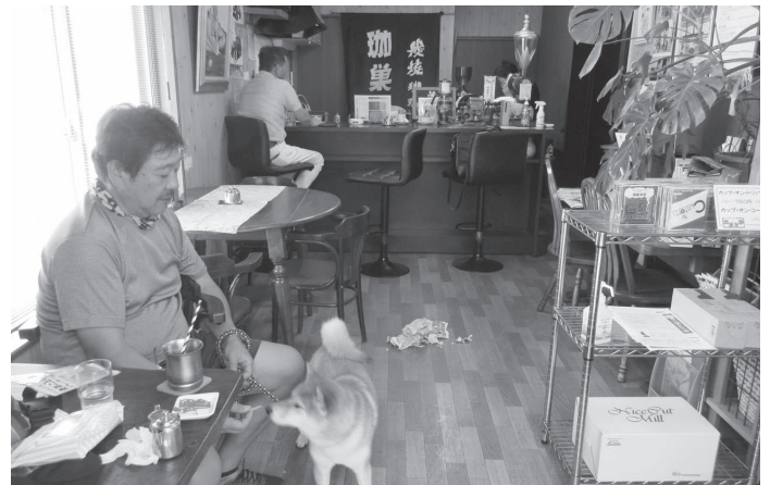
かわいいペットを連れて来店するお客さんも

最後に、お店から国見地区の皆さんに向けて、「柏木店は国見地区からもすぐ近くにあり。通りすがりに、焼き立てで香り高く、おいしい豆をお求めに、くつろぎの時間をお楽しみに、ぜひいらしてください」とメッセージを寄せてくれました。