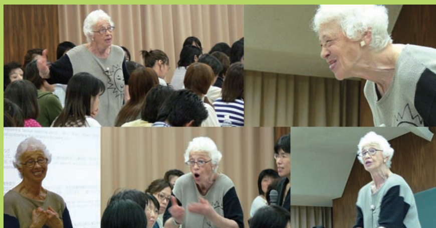
ナオミ・フェイルによる「バリデーションセミナー2008」

アルツハイマー型認知症および類似の認知症の高齢者とコミュニケーションを行うための方法の一つです。認知症の高齢者に対して、尊敬と共感をもって関わることを基本とし、お年寄りの尊厳を回復し、引きこもりに陥らないように援助する実用的なテクニックです。認知症のお年寄りだけでなく、ケアワーカーや、お年寄りの介護をする家族にとっても役に立ちます。