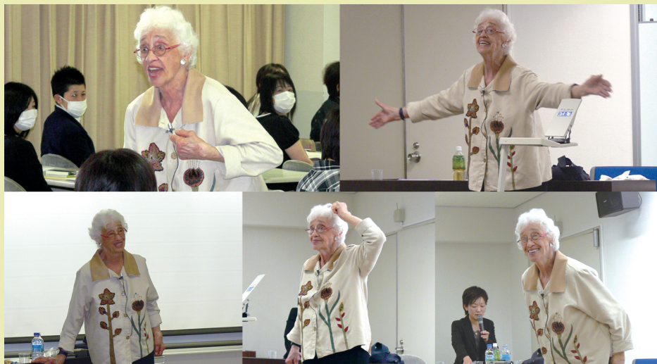
ナオミ・フェイル氏による「バリデーションセミナー2009」

アルツハイマー型認知症および類似の認知症の高齢者とコミュニケーションを行うための方法の一つです。認知症の高齢者に対して、尊敬と共感をもって関わることを基本とし、お年寄りの尊厳を回復し、引きこもりに陥らないように援助する実用的なテクニックです。認知症のお年寄りだけでなく、ケアワーカーや、お年寄りの介護をする家族にとっても役に立ちます。