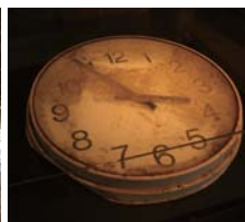
震災遺構 仙台市立荒浜小学校 (住所：仙台市若林区荒浜字新堀端 32-1)