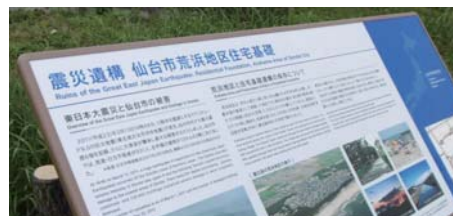
震災遺構・仙台市荒浜地区住宅基礎 (住所：仙台市若林区荒浜字中丁) *「荒浜記憶の鐘」隣接地