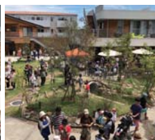
アンダンチ (住所：仙台市若林区なないろの里 1-19-2)