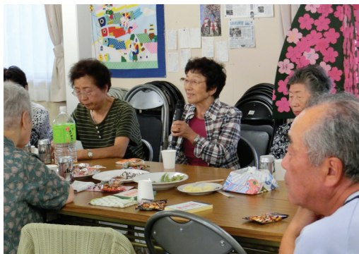
みんな集まると話題が尽きない

また、クラブ活動や仮設住宅内で催しがあるときには、ふだんなかなか外に出てこない住民へ、高齢者クラブの役員が積極的に声をかけを行っている。「この仮設住宅は南三陸町協会の支援員さんが訪問してくれていて、本当に助かっていて。だから私たちは特別「見