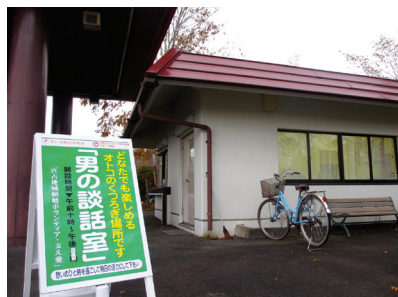
気軽に立ち寄れる男性の居場所としてオープン

この男性の居場所を運営しているのが、傾聴ボランティア「支え愛」の男性メンバーだ。傾聴ボランティアは、震災前の2006年から同市宮