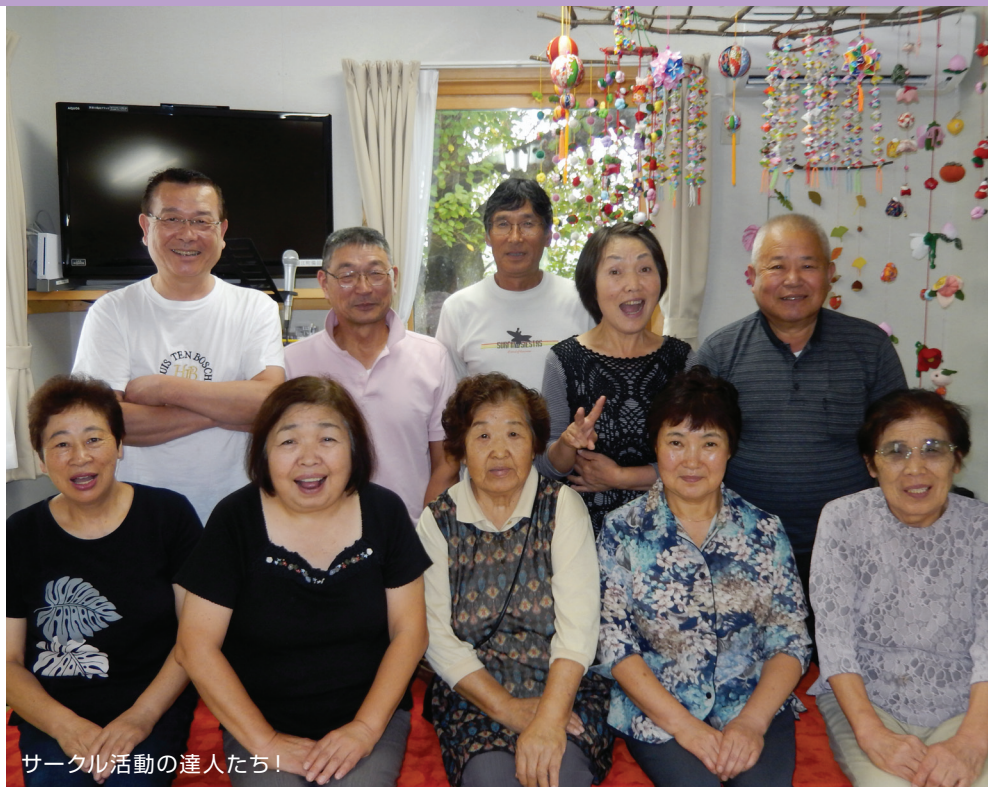
サークル活動の達人たち!