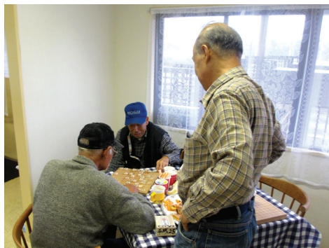
将棋の相手は、自然と集まる仲間たち