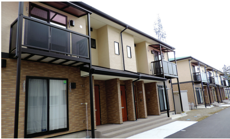
2階建てアパート形式の災害公営住宅・御蔵場住宅（24戸）

美里町では3か所の災害公営住宅で入居が始まり、新たな暮らしを支える動きが活発だ。支援が必要と思われる入居者宅には、町や県が仮設住宅を対象に実施した健康調査結果をもとに、地元の民生・児童委員と地域包括支援センター、町社協と一緒に訪問し、顔合わせを行っている。入居者にとっては、地元の住民