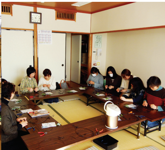
みんなで相談し合いながら作業は進みます