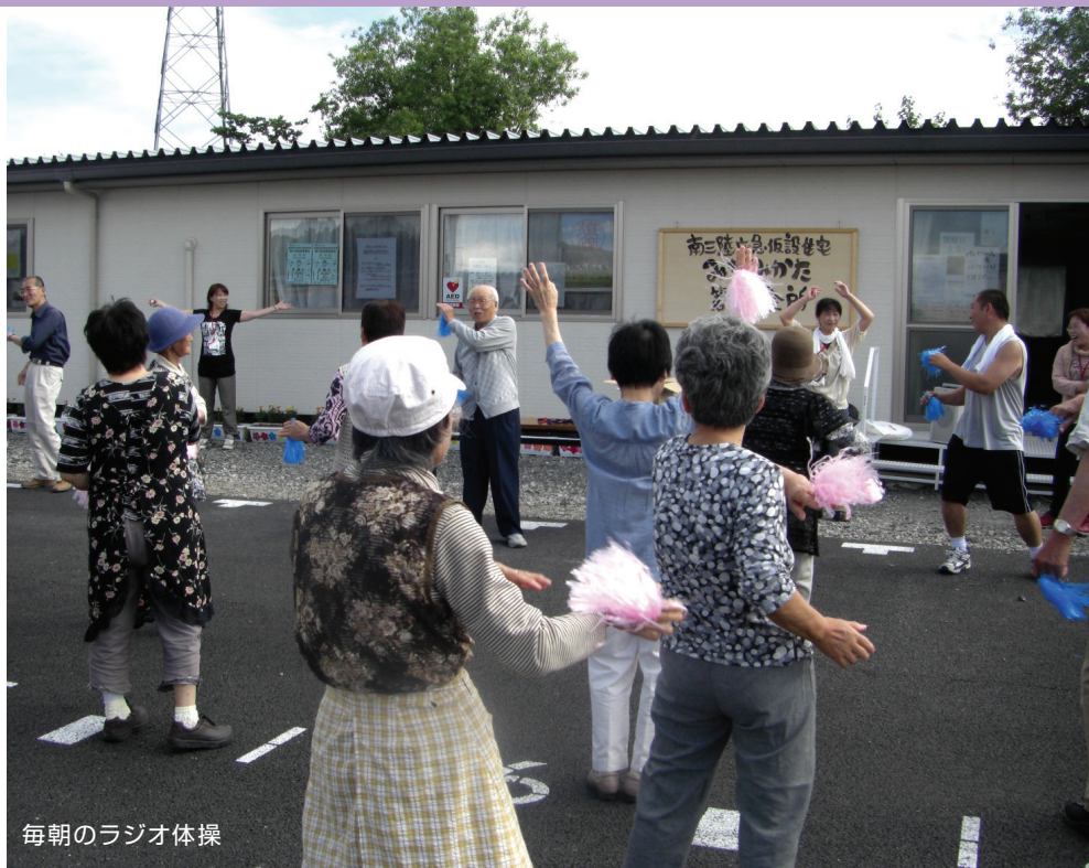
毎朝のラジオ体操