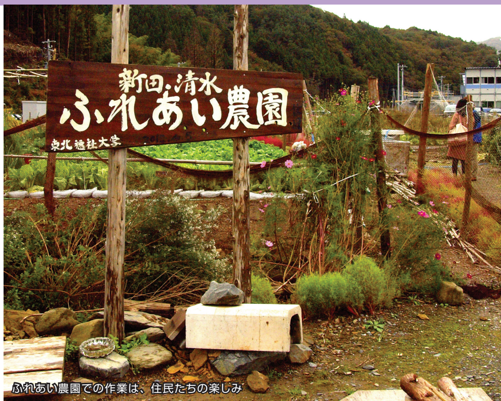
ふれあい農園での作業は、住民たちの楽しみ