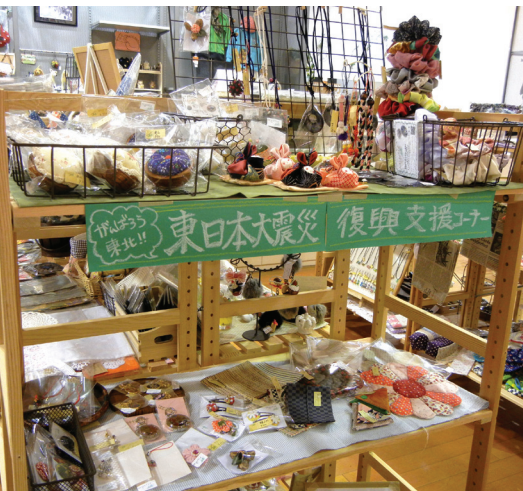
作品は市内3か所で販売