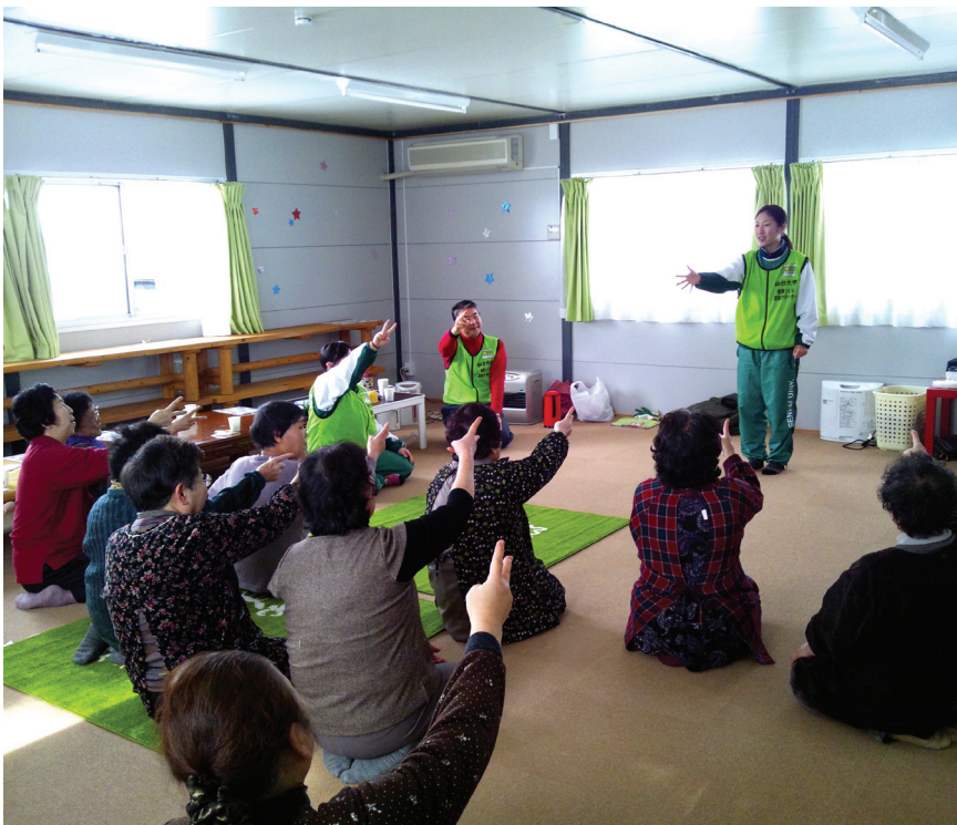
中塚仮設団地でのボランティアグループ主催のお茶のみ会

一方、仮設住宅では月5回のお茶のみ会が開催されてきた。町社協では、当初より52戸の中塚仮設団地の集会所で、地元のボランティアやおおさきレクリエーション協会の協力を得て、ニュースポーツやおしゃべりを楽しむ「すまいるサロン」を週1回運営。また、地元の主婦で構成される「ボランティアグループ中塚」主催の月1回のお茶のみ会では、仙台大学の協力を得て仮設住宅だけでなく周辺地域の高齢者も交じり、軽体操やボランティアによる地場の手料理を囲んで懇親してきた。常連の参加者の姿が見えないときには、ボランティアが家を訪ねて食事を出前しながら安否を確認するなど、地域のなかでゆるやかな見守り活動が展開されている。