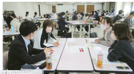
10月28日に対面研修で開催した【地域づくり推進コース】では、休憩時間も名刺交換や情報交換を楽しむ姿が見られた